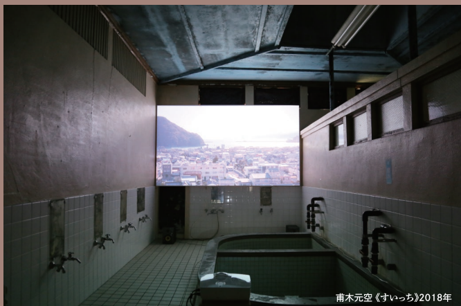
甫木元空《すいっち》2018年