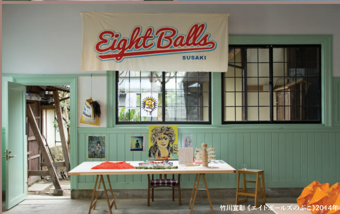
竹川宣彰《イトボールズのぶこ》2014年